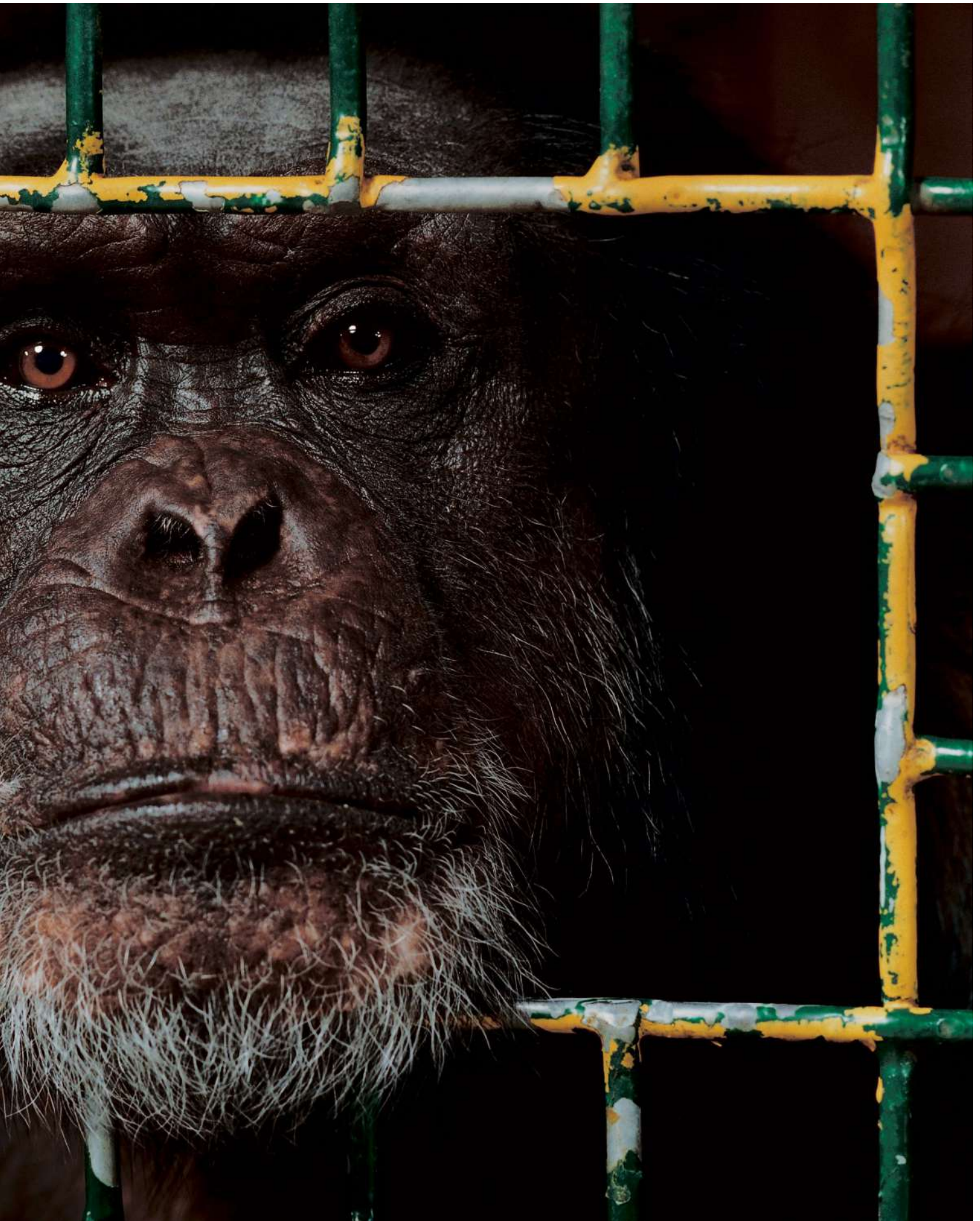
3 Knochenmarkbiopsien, 43 Leberbiopsien, beide Daumen abgekaut. Mag die Gymnastikshow am Fernsehen und Budweiser.